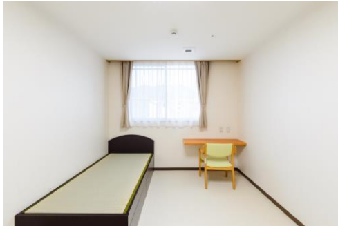
1階高齢・障がい者用居室