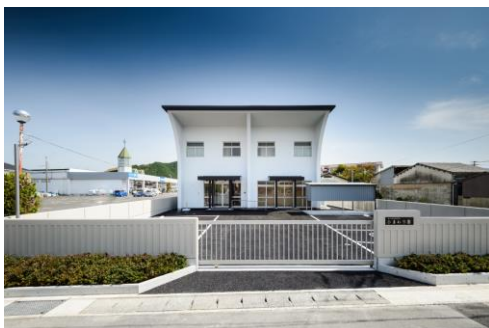
正面からみた外観

なお、平成28年5月20日、山口市所在の湯田温泉ユウベルホテル松政において、約100名の参列を得て、更生保護施設山口更生保護会落成記念式典が行われた。